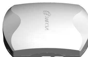
Рисунок 1. Внешний вид прибора

Прибор изготовлен в пластмассовом корпусе (рисунок 1).