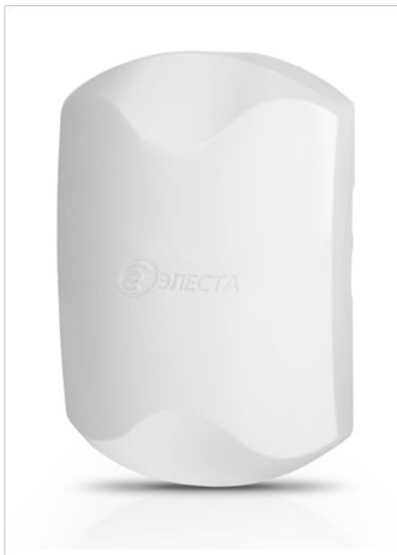
Рисунок 1 – Внешний вид прибора «Юпитер-2421»

Прибор выпускается в пластиковом корпусе, со светодиодной индикацией. Внешний вид прибора представлен на рисунке 1.