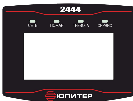
Рисунок 3. Внешний вид панели индикации

На лицевой панели прибора расположены жидкокристаллический дисплей и светодиодные индикаторы (рисунок 3), режимы работы светодиодных индикаторов описаны в таблице 2.