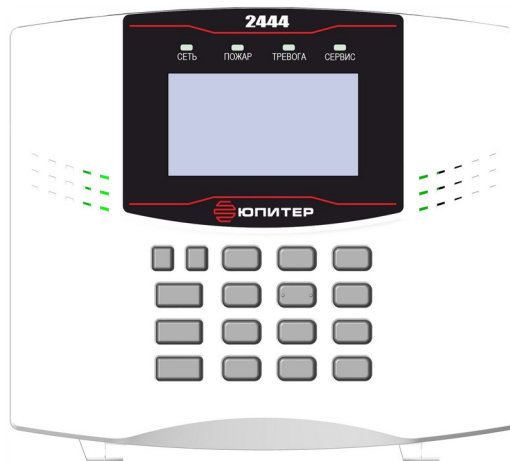
Рисунок 1. Внешний вид прибора

Прибор изготовлен в пластмассовом корпусе, на его передней панели расположены кнопки управления, жидкокристаллический дисплей и четыре светодиодных индикатора (рисунок 1).