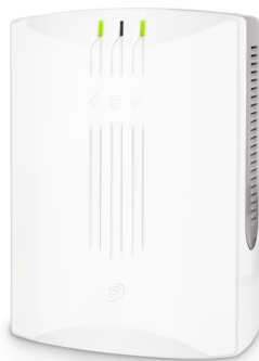
Рисунок 1 – Внешний вид изделия

Изделие предназначено для питания постоянным электрическим током средств пожарно-охранной сигнализации, устройств промышленного и бытового назначения, требующих при эксплуатации бесперебойного питания. Изделие рассчитано на непрерывную круглосуточную работу. Внешний вид изделия приведен на рисунке 1.