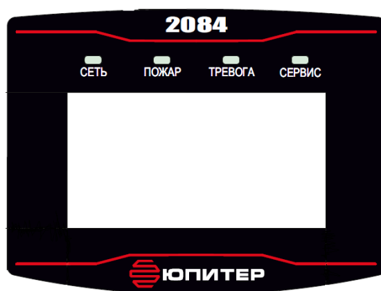
Рисунок 3. Внешний вид панели индикации

На лицевой панели прибора расположены жидкокристаллический дисплей и светодиодные индикаторы (рисунок 3), режимы работы светодиодных индикаторов описаны в таблице 2.