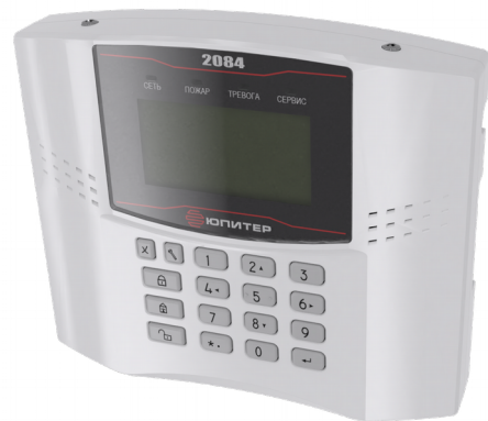
Рисунок 1. Внешний вид прибора

Прибор осуществляет связь с радиоканальными извещателями по двустороннему шифрованному протоколу. Частота радиоканала 868 МГц.