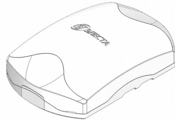
Рисунок 1. Внешний вид прибора

Прибор изготовлен в пластмассовом корпусе (рисунок 1).