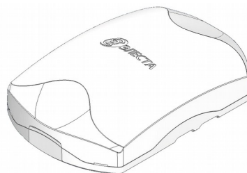
Рисунок 1. Внешний вид прибора

Прибор изготовлен в пластмассовом корпусе (рисунок 1).