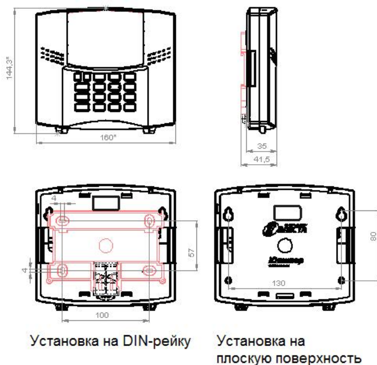
Рисунок 2. Габаритные и установочные размеры прибора

Прибор навешивается на два шурупа, ввинченных в стену согласно установочным размерам, и фиксируется другими шурупами через отверстия в задней крышке корпуса (рисунок 2).