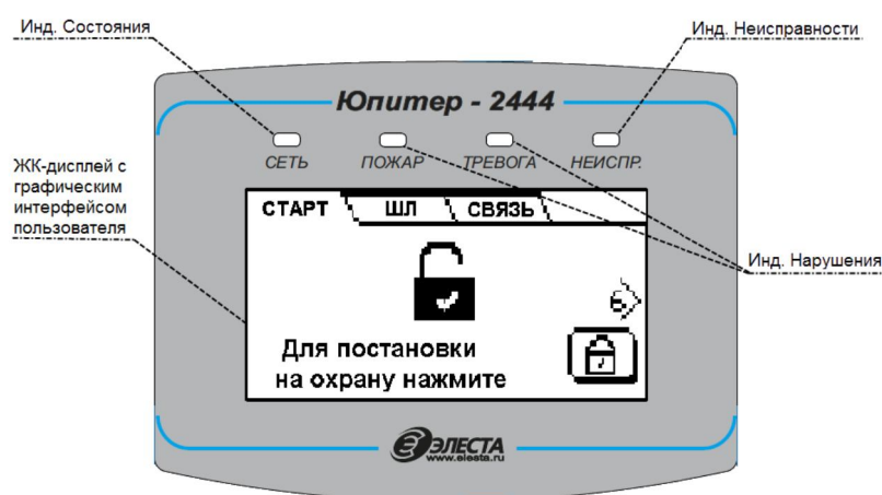
Рисунок 3. Внешний вид панели индикации

На лицевой панели прибора расположены жидкокристаллический дисплей и светодиодные индикаторы (рисунок 3), режимы работы светодиодных индикаторов описаны в таблице 2.