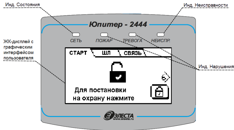
Рисунок 3. Внешний вид панели индикации

На лицевой панели прибора расположены жидкокристаллический дисплей и светодиодные индикаторы (рисунок 3), режимы работы светодиодных индикаторов описаны в таблице 2.