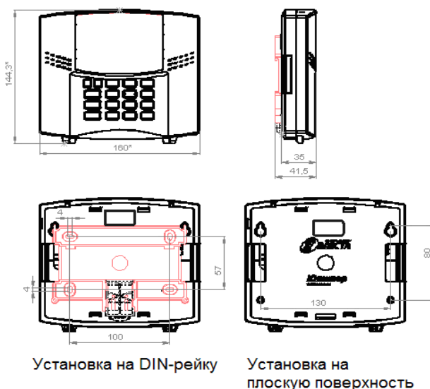
Рисунок 2. Габаритные и установочные размеры прибора

Прибор навешивается на два шурупа, ввинченных в стену согласно установочным размерам, и фиксируется другими шурупами через отверстия в задней крышке корпуса (рисунок 2).