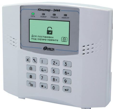
Рисунок 1. Внешний вид прибора

Прибор изготовлен в пластмассовом корпусе, на его передней панели расположены кнопки управления, жидкокристаллический дисплей и четыре светодиодных индикатора (рисунки 1).